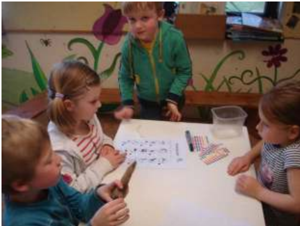
De paarse groep