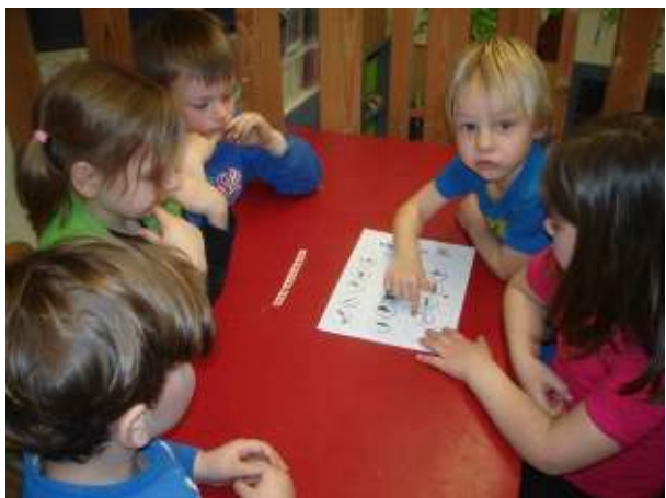
de rode groep