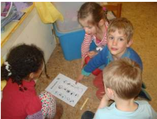
De gele groep