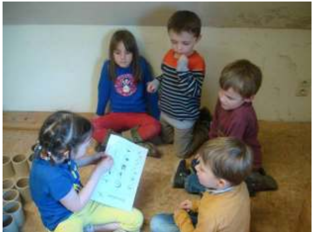
de oranje groep