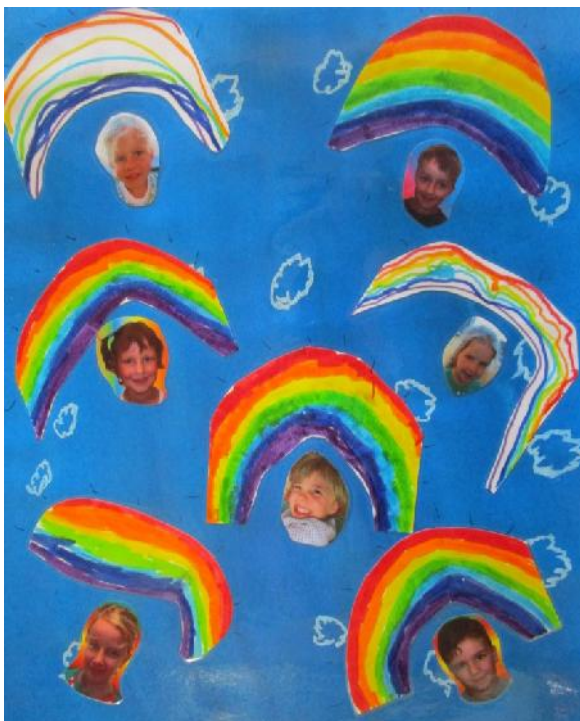
De stralende regenbogen