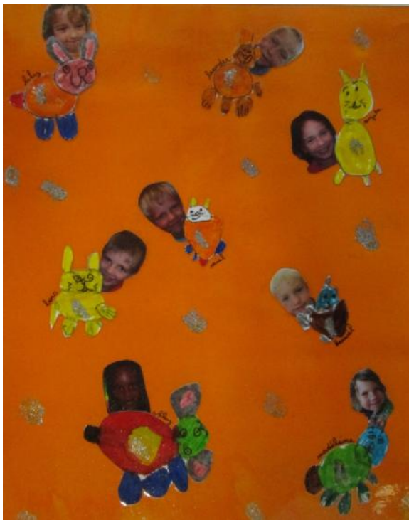
De stoere blinkende konijnen