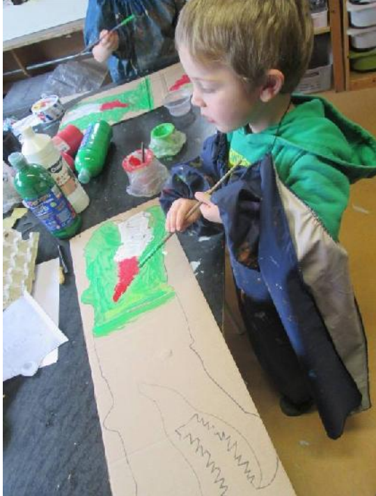
Ze waren er wel een dagje zoet mee 😊