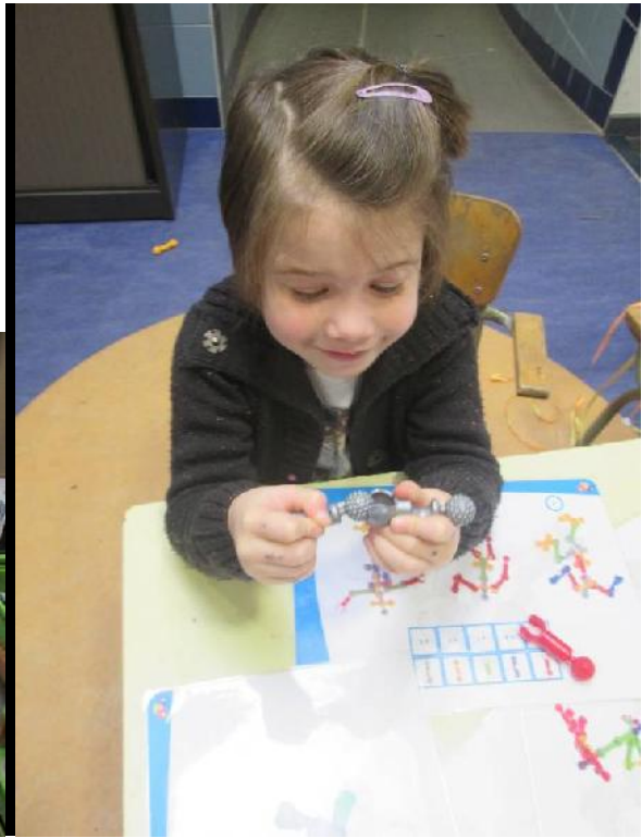
De Zoob kwam nog eens boven water.