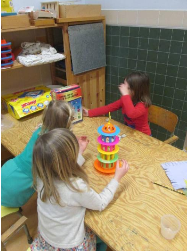
een toren van Pisa.