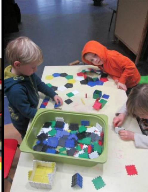
Trotste vriendjes met hun plaatjeswerken.