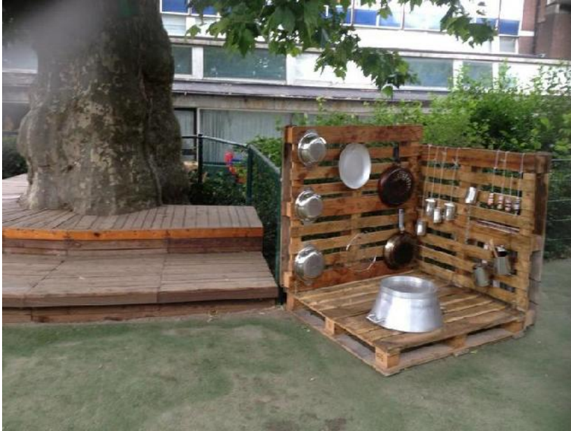
zoiets als dit...