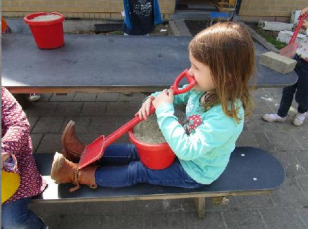
Maar daarna kon er duchtig gespeeld worden!