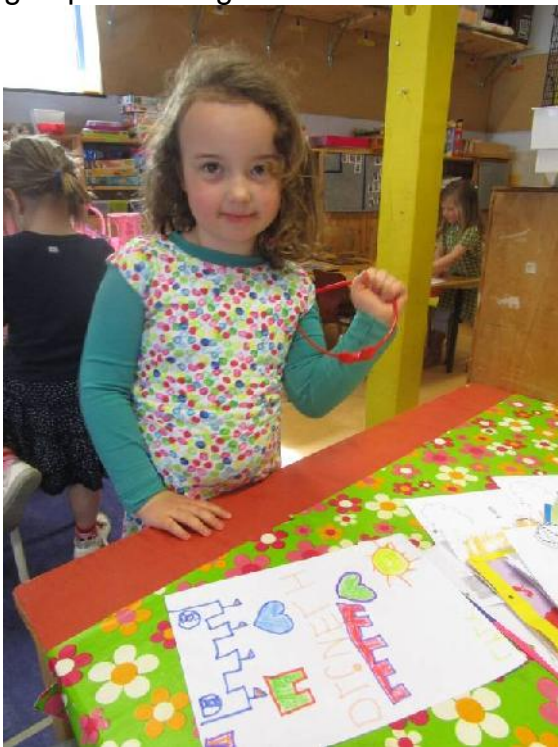
ondertussen probeer ik zo goed mogelijk vrije teksten te noteren bij de gemaakte tekeningen. Daar kruipt echt wel veel tijd in dus wordt nog steeds vervolgd...