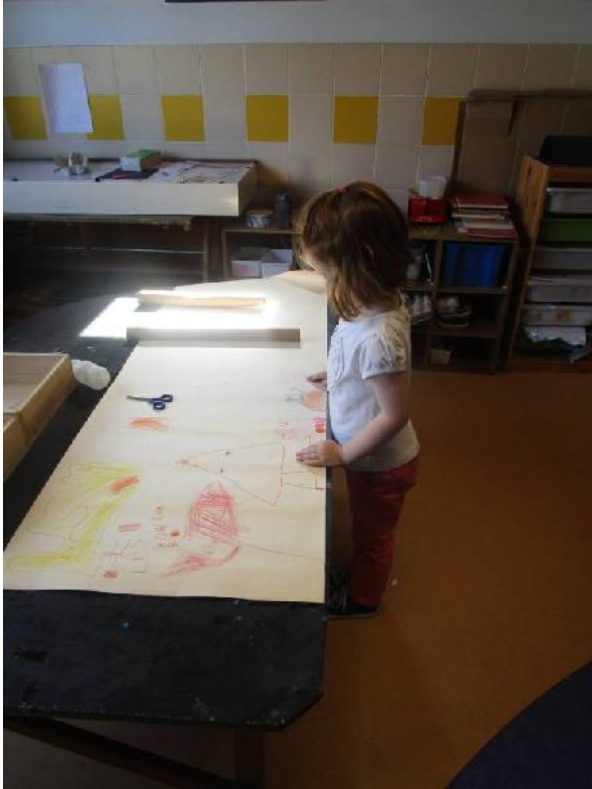
Bij de grote knutseltafel kon een groepsverhaal gemaakt worden.