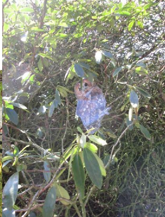
We gingen vogels bekijken achter een muur met kijkgaatjes.