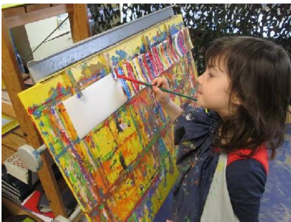
Een verjaardagskroon schilderen.