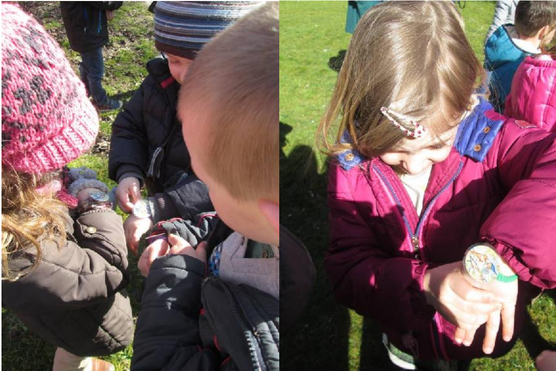
We hielden een vogelgeluiden concert zodat de bosuil zijn stem zou terug vinden.