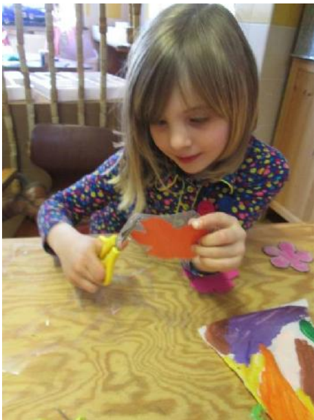
een voederplankje maken.