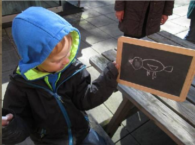
We kregen een verrekijker om vogels te spotten.