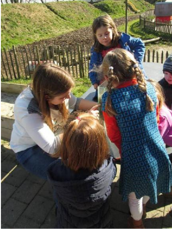
zie je de gangen die ze graven?