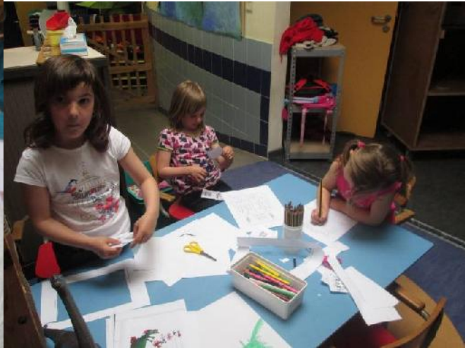
De opdracht: kroontjes van groot naar klein sorteren vond in elk geval veel bijval. Verder werd natuurlijk ook heel veel in onze aangepaste hoekjes gespeeld.