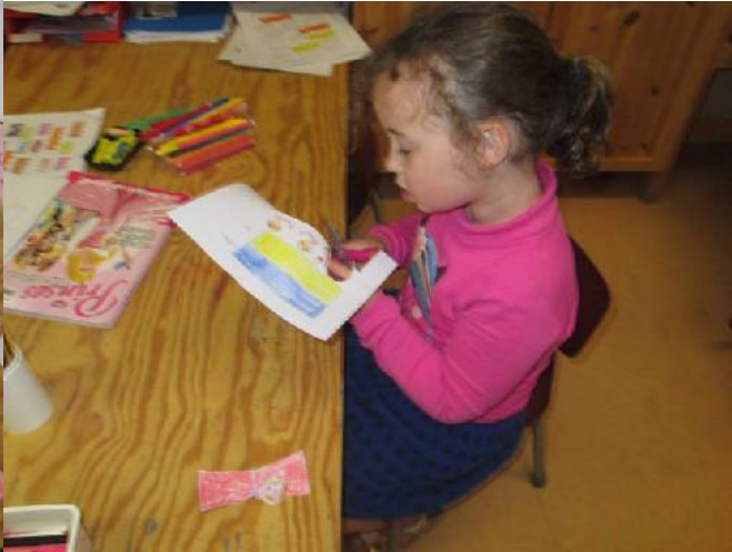
De verkoop in onze prinsessen klerwinkel boomt ☺