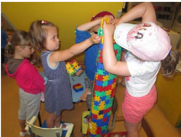
Enkele kinderen willen ook echt met alle clics een grote toren bouwen.