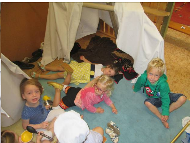
De tipi is verhuisd naar de poppenhoek...