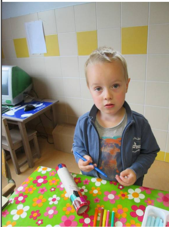
(afwerken van de pijlenkoker)