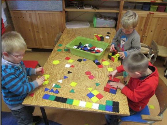
Ik haalde de kleine plaatsjes boven. Verwoed gingen de bouwers aan de slag.