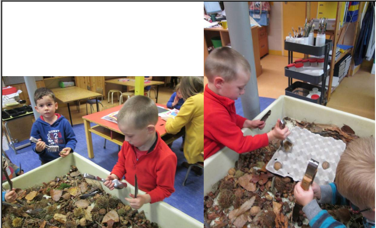
We probeerden noten in eierkartonnen te krijgen. Dat lukte best aardig!