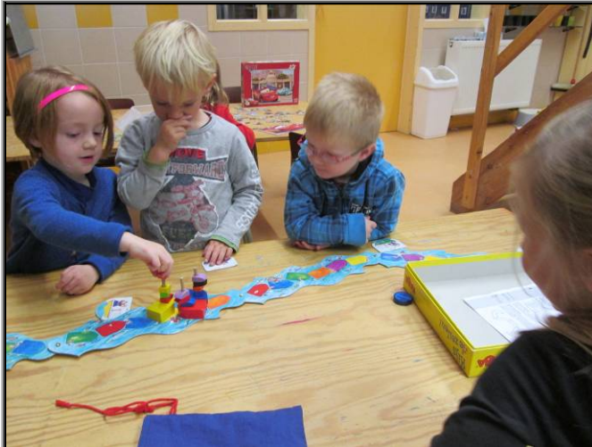
De puzzelmicrobe is er nog steeds ☺