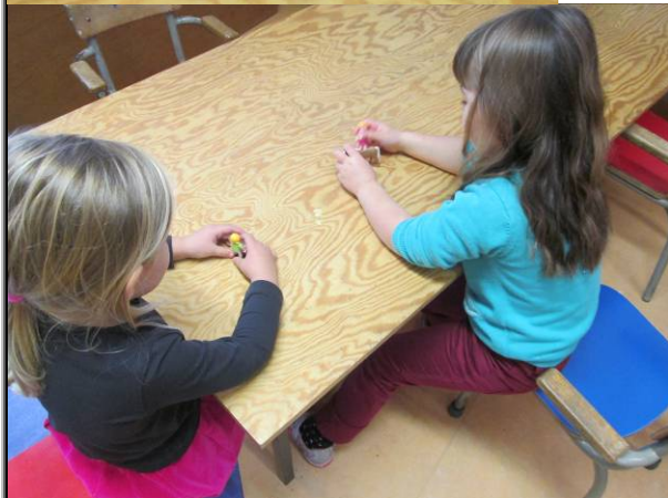
Floor bracht playmobil mee