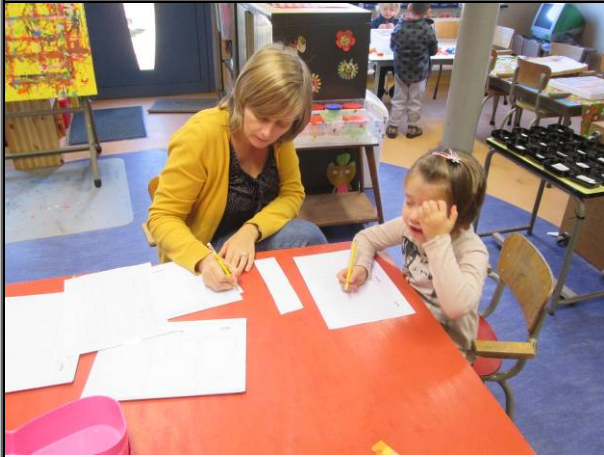
huisje, boompje, mannetje