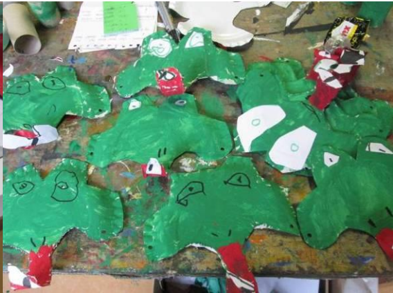
De knutselmarathon werd aangenaam afgewisseld met een Yoga-sessie door Eva