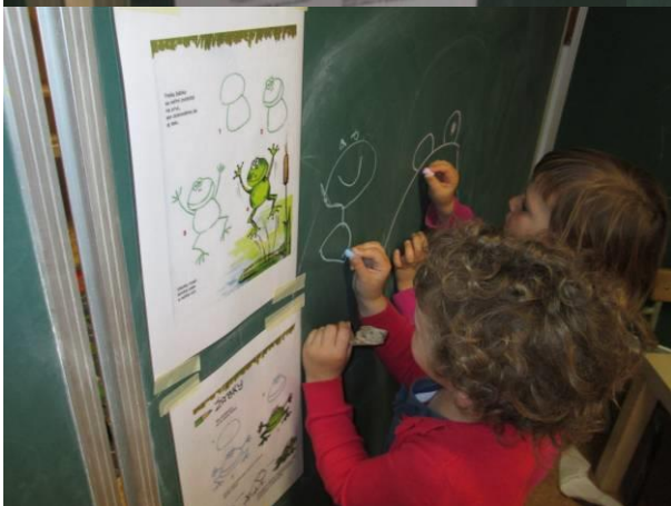
Een van de dingen op ons 'wat willen we doen' blad: kikkers tekenen.