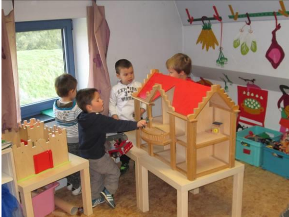
ons klein poppenhuis werd een slagveld voor de ridders.