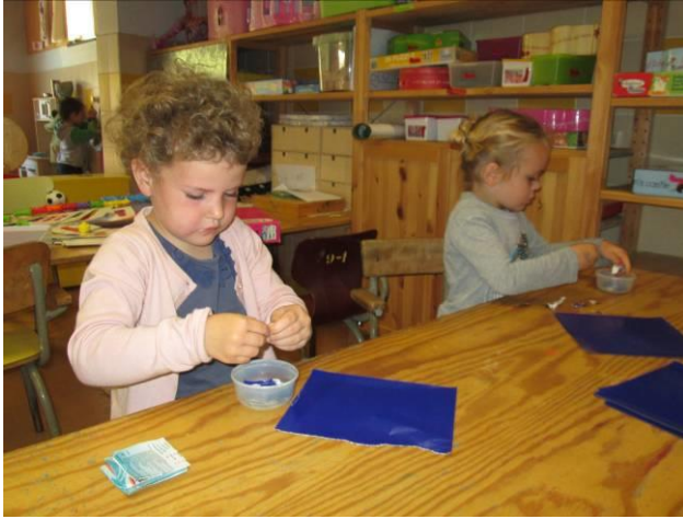
Een groepje koos voor een kikkerwerk met waterverf.